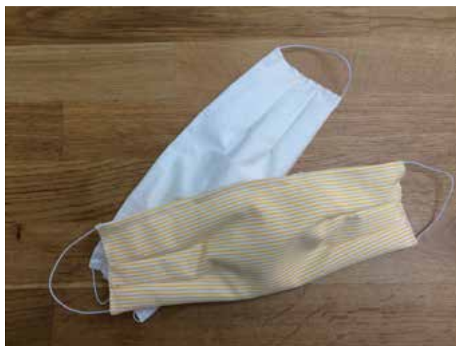
Pop [lab] fabrique de masques – Confinement #01

Parce que « Qui se nourrit d'attente risque de mourir de faim », la Maison populaire continue de faire exister ce qui peut l'être entre ses murs et de manière virtuelle et s'engage dans les actions pour la réouverture des lieux culturels, nombreuses en ce mois de mars 2021.