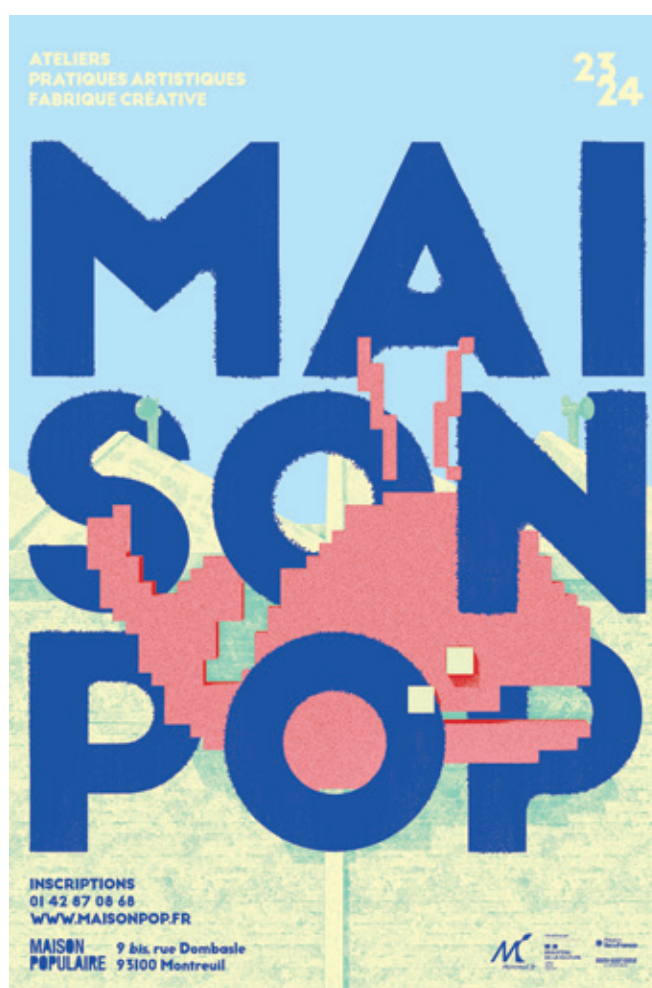
Affiche MAISON POP 23/24