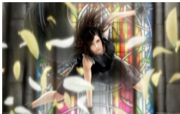
Final Fantasy VII : Advent Children

L'irruption de la culture virtuelle (les jeux vidéo puis Internet) à la fin du XXe siècle modifie à nouveau l'environnement du cinéma. Les jeux vidéo et Internet occupent une partie croissante des loisirs du jeune public, faisant de ces mondes virtuels de nouveaux concurrents pour le cinéma. L'influence du jeu vidéo sur le cinéma, relativement récente, est encore modeste mais croissante. On voit apparaître quelques adaptations de jeu vidéo au cinéma, comme Final Fantasy ou Tomb Raider (tous deux en 2001), ainsi que des films s'inspirant de jeu vidéo dans le fond, dès Tron en 1982 ou plus récemment avec eXistenZ (1999), ou dans la forme, comme dans Matrix (1999), Fulltime Killer (2001) ou encore Cloverfield (2007).