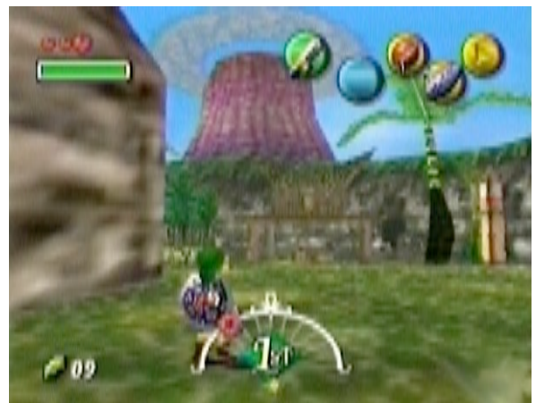
Zelda - Majora's Mask

Quant à la vue à la première personne (sur laquelle reposent Wolfenstein 3D , Doom , Quake et leurs très nombreux héritiers), il s'agit d'une transposition virtuelle de la vue subjective du cinéma, l'action est ainsi vue à travers les yeux du personnage.