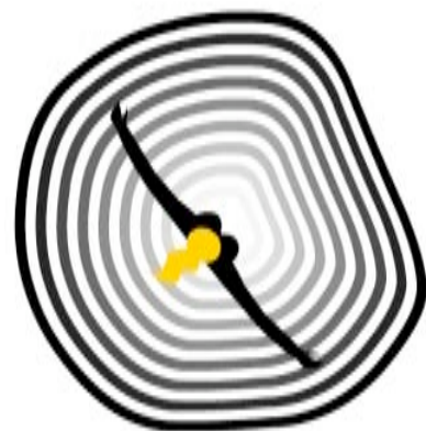
whatremainsisfuture.com, Angelo Plessas

« Les sites Internet sont l'art de notre temps » proclame le manifeste Neen. Ainsi, au fil du temps, et de leur inspiration, les « neenstars » produisent des sites qui sont des animations flash, interactives ou pas, qui sont l'expression de pensées neen du moment. Le rêve des neenstars : créer des .com qui seront ensuite achetés comme des œuvres d'art par des collectionneurs.