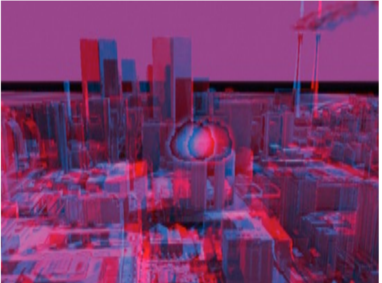
Urban proof, par Dardex Mort2Faim, 2008