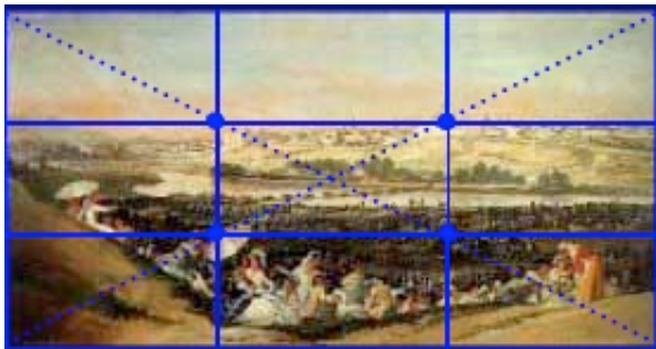
Goya, Prairie de San Isidro (1775)

L'image en mouvement se plie à quelques règles de composition, souvent issues du monde de la peinture classique comme la règle dite « des 3 tiers » où une image coupée en son milieu paraît sans intérêt, hésitant entre ciel et sol.