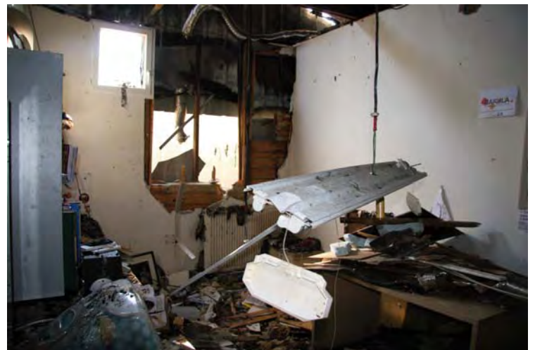
Le bureau de Stéphane