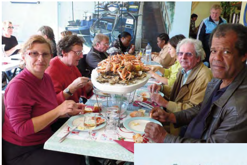
Rien à ajouter !