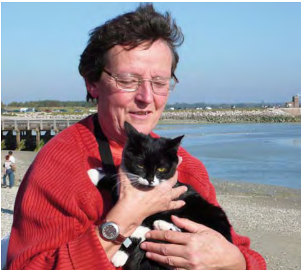
Louison, le chat, était aussi du voyage