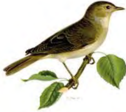
La fauvette des jardins a donné à Olivier Messiaen le matériau et le titre éponyme pour piano

Au grand orgue de la Trinité, à cette tribune où il avait officié et établi sa « demeure », il faisait « corps avec la liturgie ».