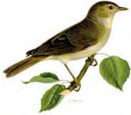
La fauvette des jardins a donné à Olivier Messiaen le matériau et le titre éponyme pour piano

Au grand orgue de la Trinité, à cette tribune où il avait officié et établi sa « demeure », il faisait « corps avec la liturgie ».