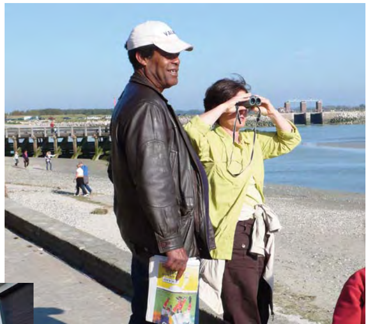
...cherchons les phoques