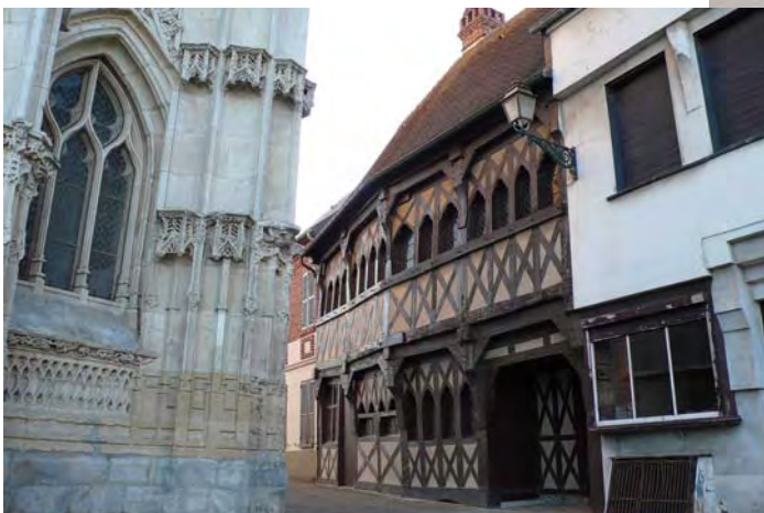
Une maison médiévale et l'église de Rue