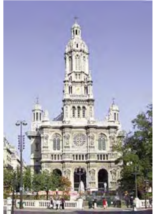
Eglise de la Trinité à Paris

Par sa profondeur spirituelle et sa richesse théologique, son œuvre permet d'approcher les grands mystères de la foi à travers le langage musical. Il a fait refléter dans sa musique les lumières que sa soif de Dieu avait recueillies. Musicien de la joie, il était naturellement disposé à entendre et restituer la musicalité de la Création, qu'il percevait tout particulièrement à travers les couleurs et le chant des oiseaux.