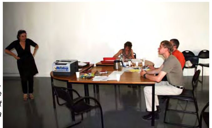
Dès le 25 juillet, l'équipe s'installe dans le centre d'art Mira Phalaina

Depuis la rentrée et encore actuellement :