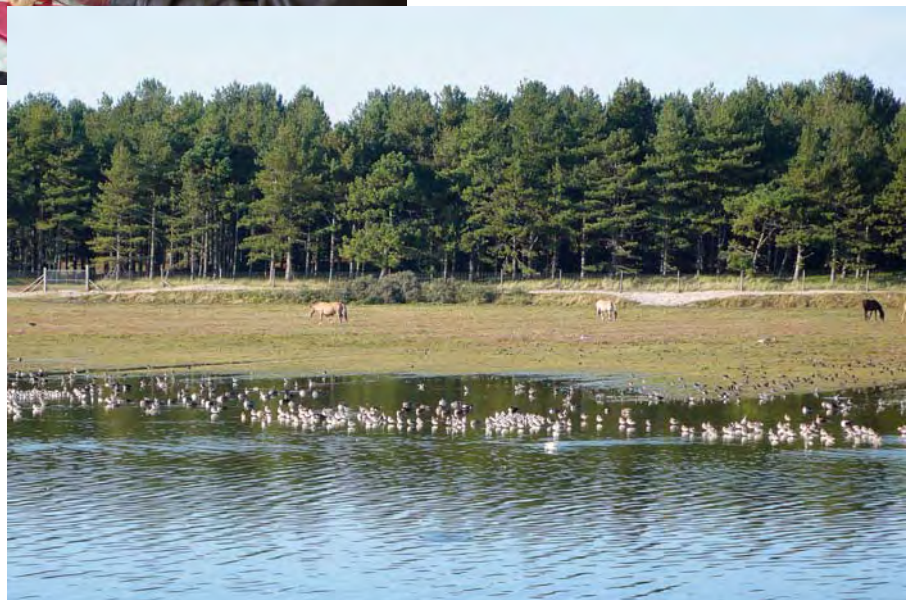
La réserve d'oiseaux