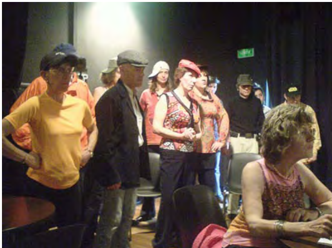
Tous en scène pour "le cri de la sardine, quand elle saute du coq à l'âne"

Il faut dire que nous sommes portés par le groupe. On devine, on décèle parmi les stagiaires les mêmes inquiétudes, les mêmes moments de stress et de doute. Dès lors, nos propres appréhensions s'atténuent voire se dissipent. On y va ! et là une sorte de frénésie nous envahit, l'exaltation nous pousse et alors... place à l'amusement et ... difficile à décrire, il faut le vivre !