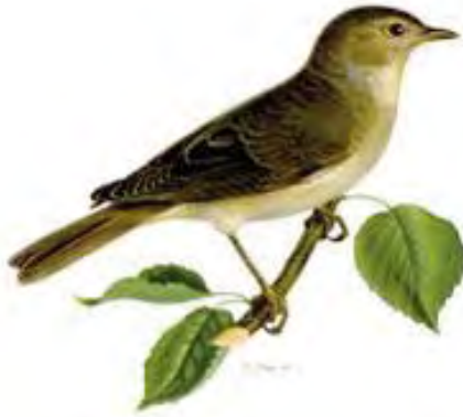
La fauvette des jardins a donné à Olivier Messiaen le matériau et le titre éponyme pour piano

Au grand orgue de la Trinité, à cette tribune où il avait officié et établi sa « demeure », il faisait « corps avec la liturgie ».