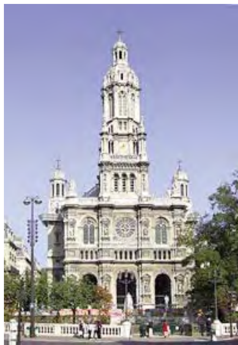
Eglise de la Trinité à Paris

Par sa profondeur spirituelle et sa richesse théologique, son œuvre permet d'approcher les grands mystères de la foi à travers le langage musical. Il a fait refléter dans sa musique les lumières que sa soif de Dieu avait recueillies. Musicien de la joie, il était naturellement disposé à entendre et restituer la musicalité de la Création, qu'il percevait tout particulièrement à travers les couleurs et le chant des oiseaux.