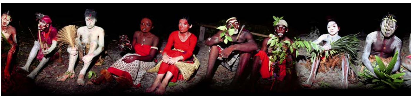
La Vision, 2003

En savoir plus : http://prix2011.aec.at/winner/3043/