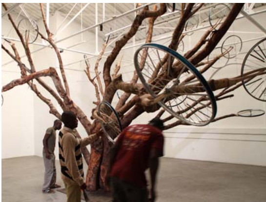
Unrooted Tree, 2009