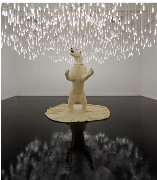
La peau de chagrin