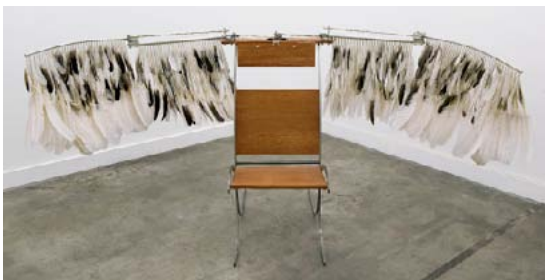
La machine à méditer sur le sort des oiseaux migrateurs