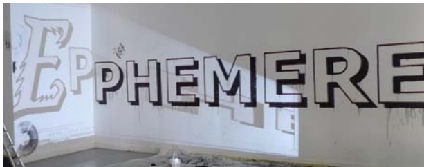
Imago, Éphémère, Ludovic Paquelier