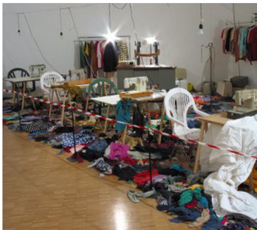
Atelier clandestin O'Black (2004-2005), exposition Dionysiac , centre Pompidou