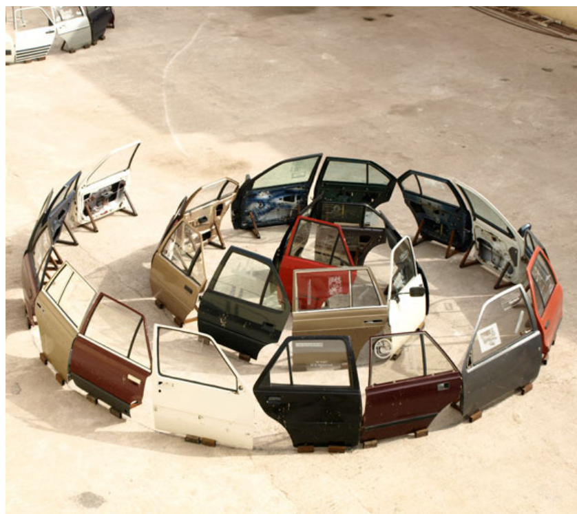
« U.N. Circle Gwangju », 2008. Produit pour « Expedition 7 (Paris, Refletivo) ». Curator: Abdellah Karroum - 7 Biennale de Gwangju 2008. (Directeur artistique: Okwui Enwezor).

« Seamus Farrell travaille directement avec l'espace. Ses installations transforment ainsi les espaces donnés, comme les salles d'exposition, à partir d'une réflexion pertinente sur le vocabulaire visuel de l'art contemporain et sur celui de notre relation à la tradition artistique et architecturale du XX e siècle. » ■