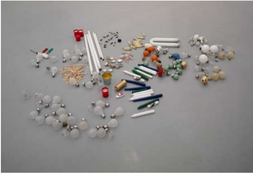
Jason Dodge, Darkness falls on Wolkowyja 74, 38-613 Polanszyk, Poland , 2005