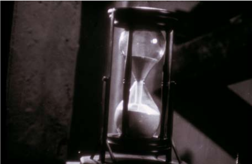
Morgan Fisher, ( ), 2003 Film 16 mm, 21 min. Courtesy Galerie Daniel Buchholz, Cologne