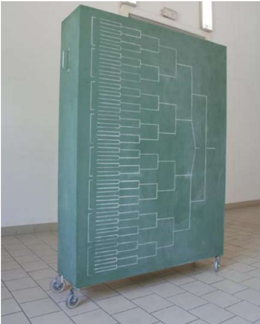
Chloé Dugit-Gros, L'Approche du résultat , 2007 Contreplaqué, peinture à tableau, craie 160 x 120 x 30cm Courtesy de l'artiste