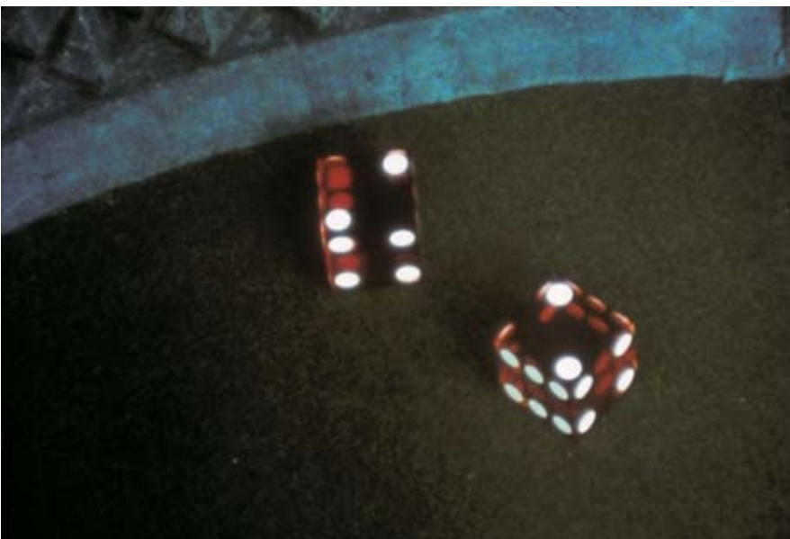
Morgan Fisher, ( ), 2003 Film 16 mm, 21 min.